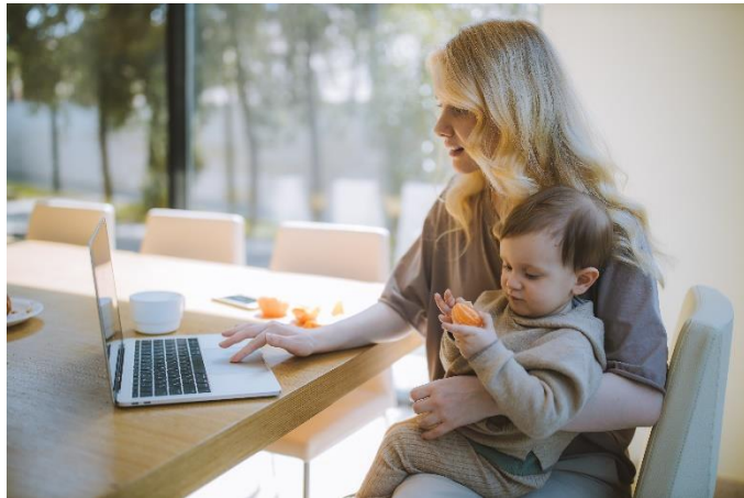
Mütter & Väter oder Pfleger