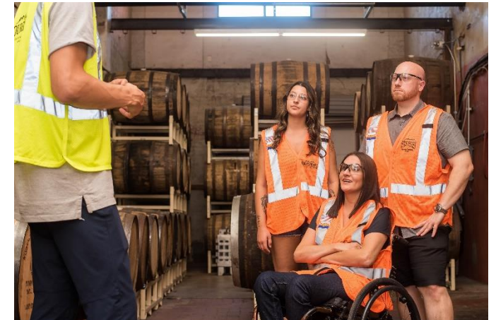
Menschen mit Beeinträchtigung